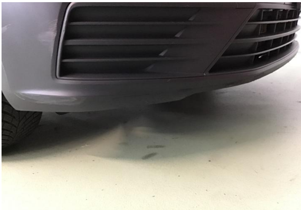
Stossstange vorne Kratzbeschädigt / Ersetzen