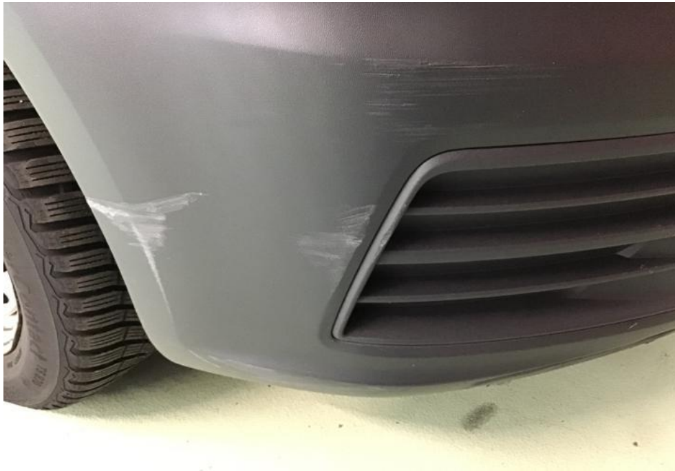
Stossstange vorne Kratzbeschädigt / Ersetzen