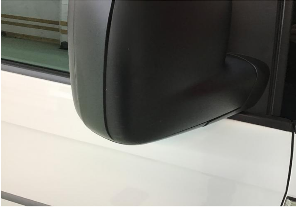
Aussenspiegel rechts Gebrauchsspur, Kratzbeschädigt